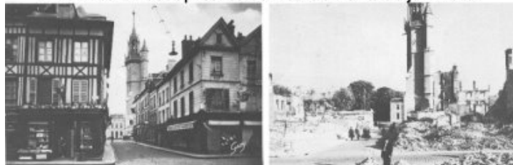
La rue du Docteur Oursel à Évreux : avant et après le bombardement allemand de juin 1940