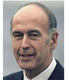
Valéry Giscard D'Estaing