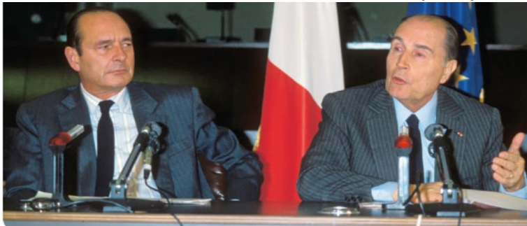
Lors d'un Conseil européen à Bruxelles en février 1988.

- En 1986 , la droite gagne les élections législatives. C'est une situation nouvelle pour la Ve République : l'Assemblée nationale, qui vote les lois avec le Sénat, est majoritairement de droite alors que le Président de la République est de gauche.